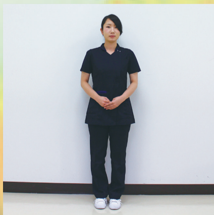
医師事務作業補助者