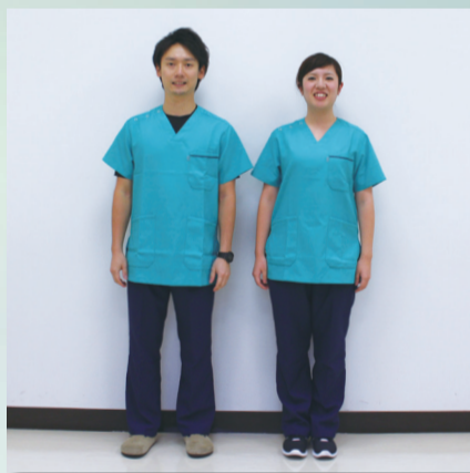
リハビリテーション技師