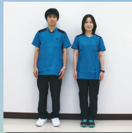
薬剤師・管理栄養士