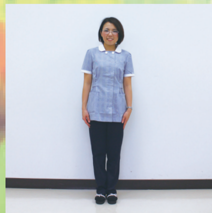
地域医療連携室事務